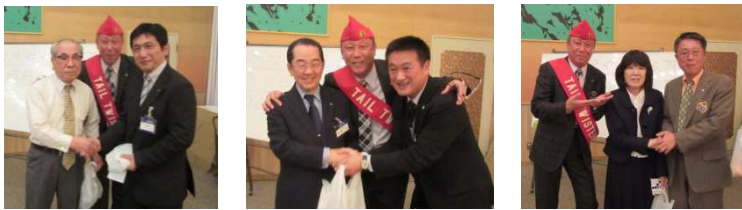
ビンゴ大会の1・2・3位の皆さん