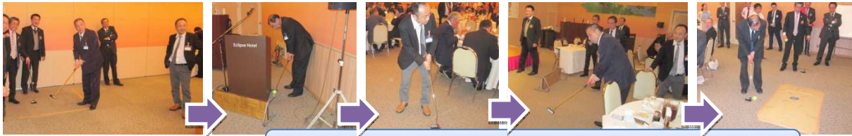
Rチームが増本以外の見事なりがりーで勝利!